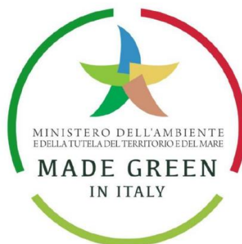
Figura 1 - Il marchio del "Made Green in Italy"